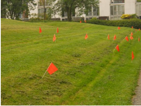
Vlaggetjes bij de drollen.

Op 28 mei 2014 gingen bewoners de hondenpoep te lijf. Dit gebeurde door het plaatsen van oranje vlaggetjes. In totaal werden door de bewoners, gemeente en Beter voor Rijswijk 220 vlaggetjes bij de drollen geplaatst. Nu maar hopen dat hondenbezitters hun best doen om het park poepvrij te houden.