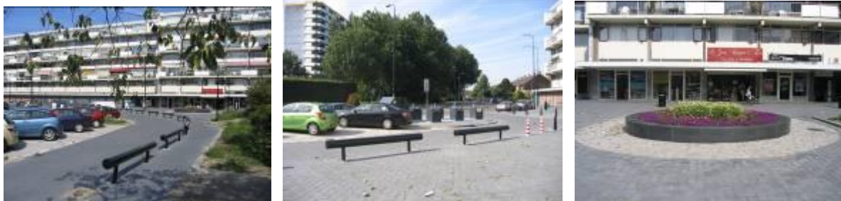
Dit voorjaar werd de buitenomgeving van het winkelcentrum voltooid. (Conform WOP-plannen)