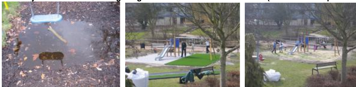
Verouderde speelplaats op drassige grond, werd geheel gerenoveerd. Het resultaat mag er zijn. En bij al deze ontwikkelingen heeft de BOSZ, met wat daarvan nog over was, inspraak gehad.